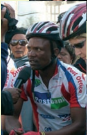
Weltposttag in Südafrika