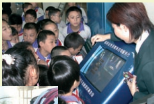
Weltposttag in China