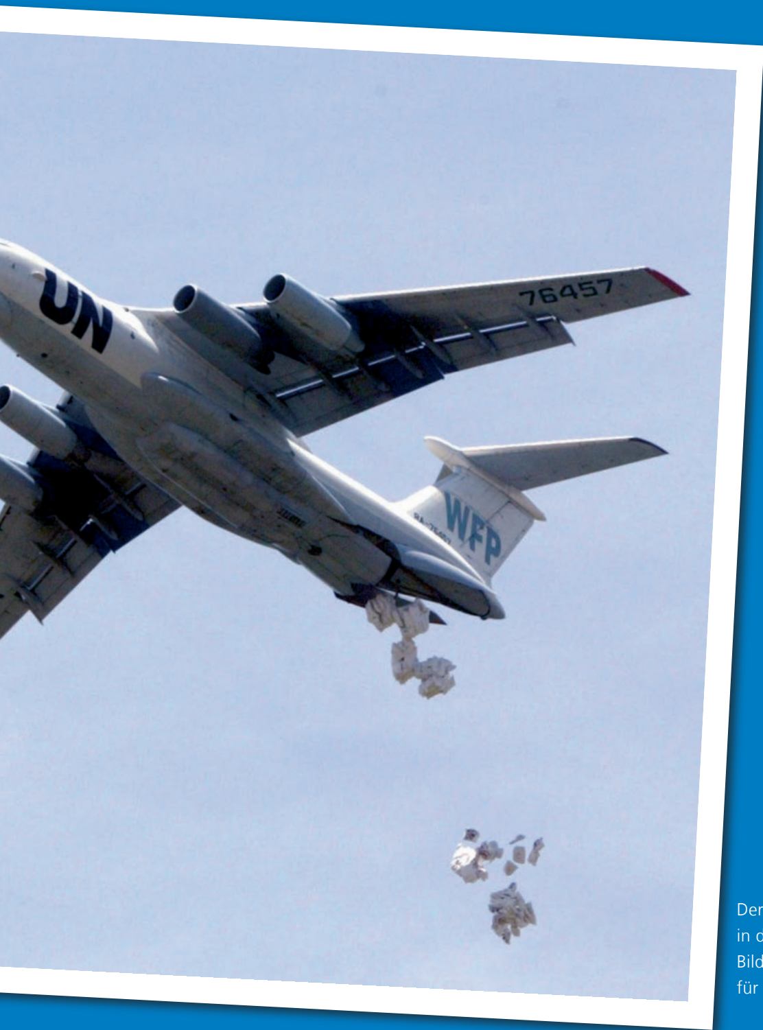
Der Sudan war ein wichtiges Thema in der UNO im Jahr 2007. Auf dem Bild der Abwurf von Nahrungsmitteln für die notleidende Zivilbevölkerung.