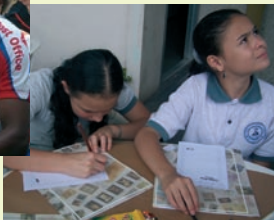
Weltposttag in Costa Rica